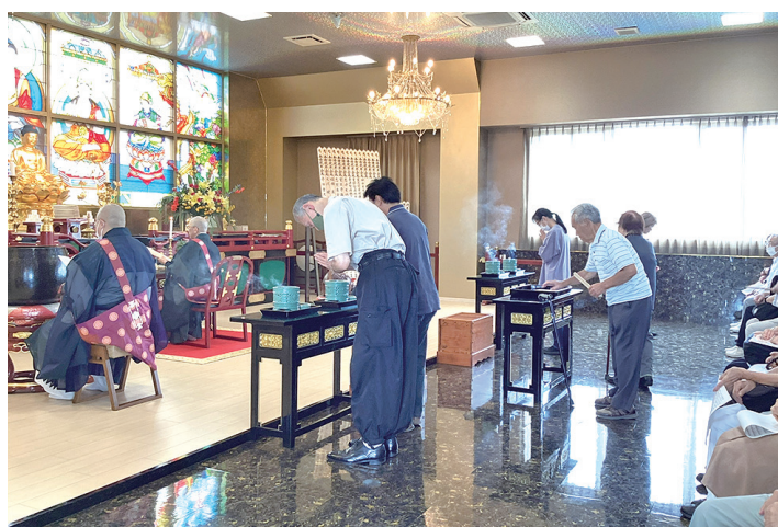
船橋中央 秋彼岸会

昨年より秋の彼岸会大法要の申込用紙も敬愛夏号に同封させていただく事となりました。盂蘭盆会をご先祖様のお戻りになる大切な法会、お彼岸はご浄土のある真西に太陽が沈む日で、ご浄土の方向に向かってご先祖様に感謝の心を伝えます。両法会とも大切なご供養となります。盂蘭盆会・施餓鬼大法要の申込書と2枚入っておりますので用紙のお間違いのないようご記入ください。お申し込みは、ホームページからでもできますのでご利用ください。