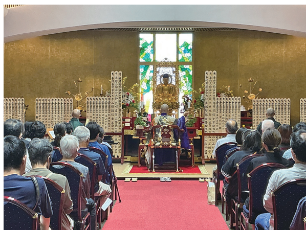
稲毛寺院 盂蘭盆会

ご参加の人数が多くなりましたので、小室寺院と稲毛寺院は二日間の開催となります。船橋中央は16日のみの開催ですが、ペットのお盆供養が同日開催されます。お申込みいただいた故人様のお名前(戒名)は、塔婆に書いて本堂にて供養いたします。詳しくは同封のお申込用紙をご覧ください、早めにお申し込みください。ホームページからもお申込みいただけます。釈迦寺ではご自宅での個別のお盆法要もお受けしておりますので、お電話にてお問合せください。